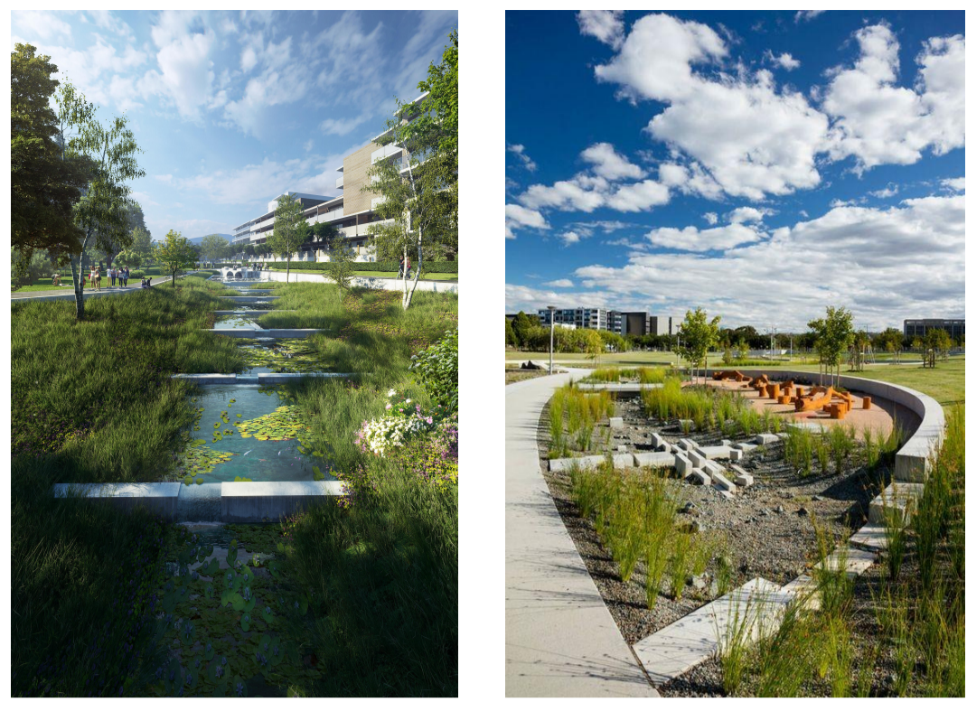
Inspirasjonsbilder for overvannshåndteringsanlegg