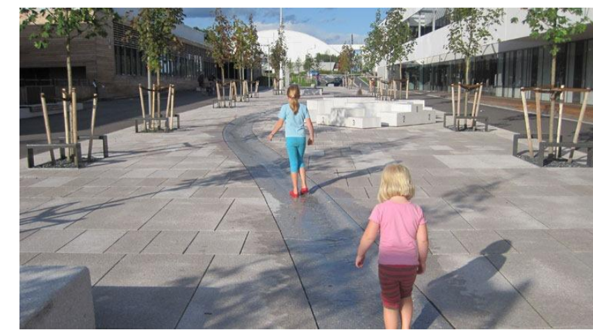
Inspirasjonsbilde for vannrenne